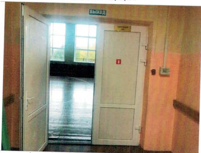
Фото №17 – Пути движения внутри здания (двери)