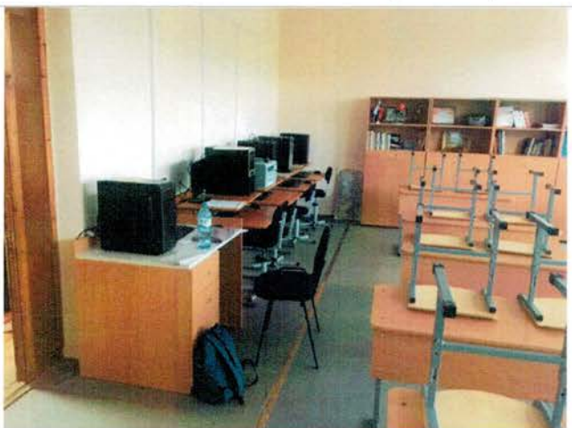
Фото №23 – Зона целевого назначения (посещения)