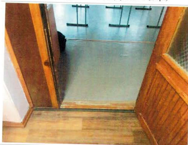
Фото №18 - Пути движения внутри здания (двери)