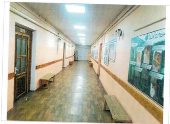
Фото №13 – Пути движения внутри здания