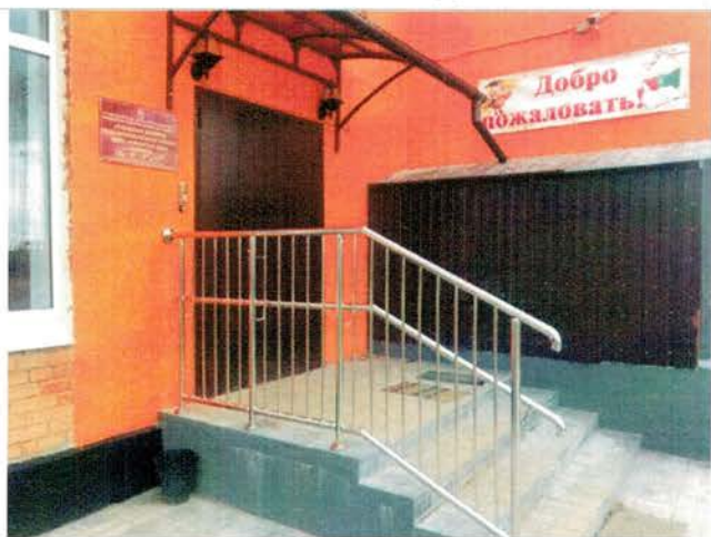
Фото №35 – Система информации