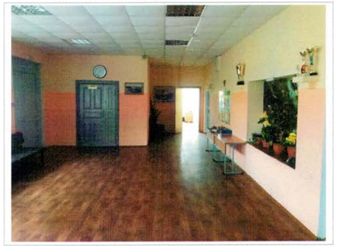
Фото №12 – Пути движения внутри здания