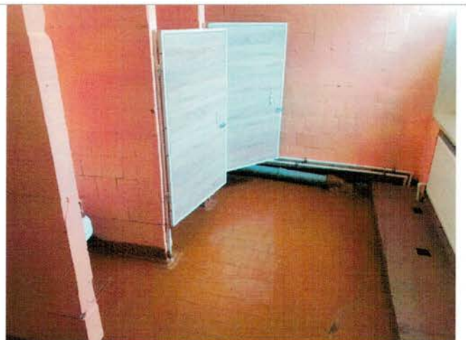
Фото №30 – Санитарно-гигиенические помещения