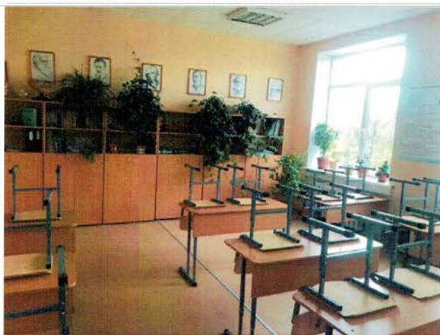
Фото №21– Зона целевого назначения (посещения)