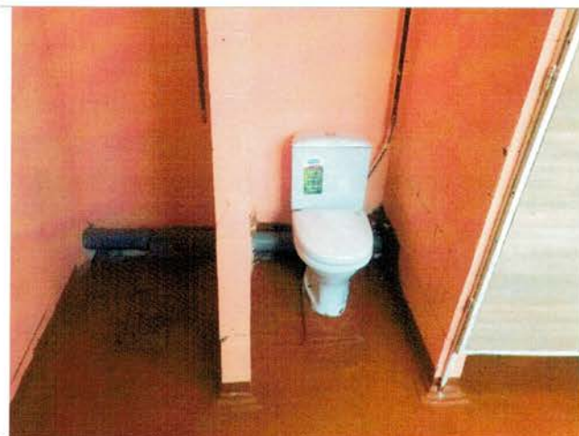
Фото №32 – Санитарно-гигиенические помещения