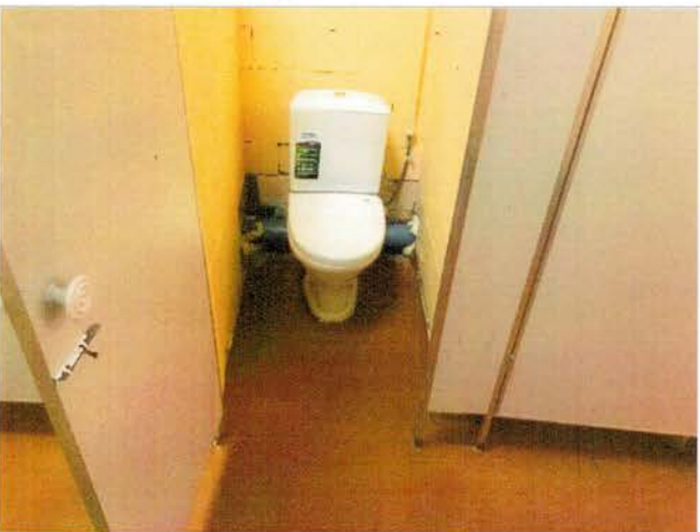
Фото №29 – Санитарно-гигиенические помещения