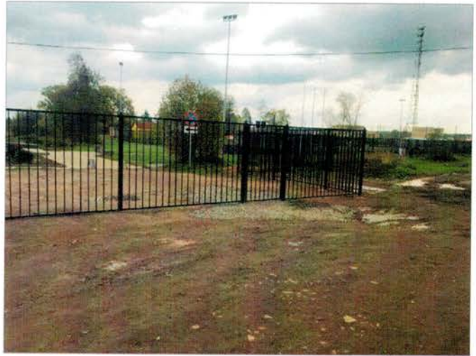
Фото №2 – Подходы к объекту