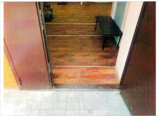
Фото №11 – Внешняя входная дверь.