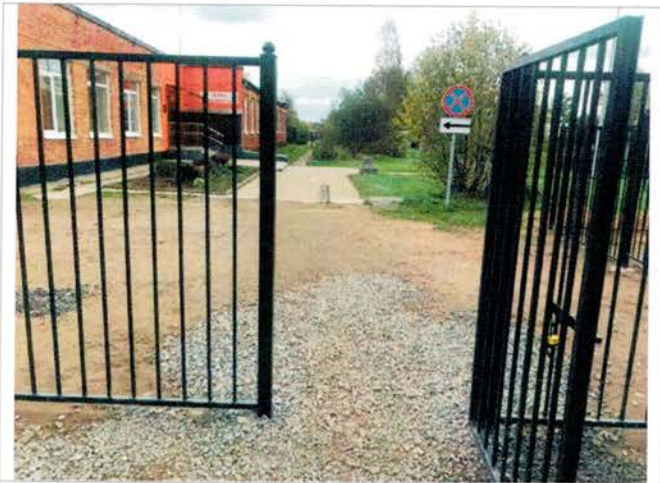
Фото №3 – Вход на территорию