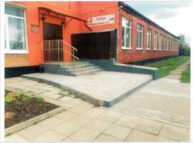
Фото №7 – Главный вход.