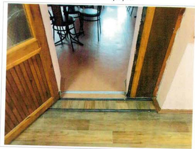
Фото №16 – Пути движения внутри здания (двери)