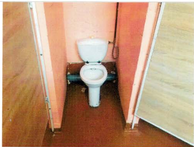
Фото №31 – Санитарно-гигиенические помещения