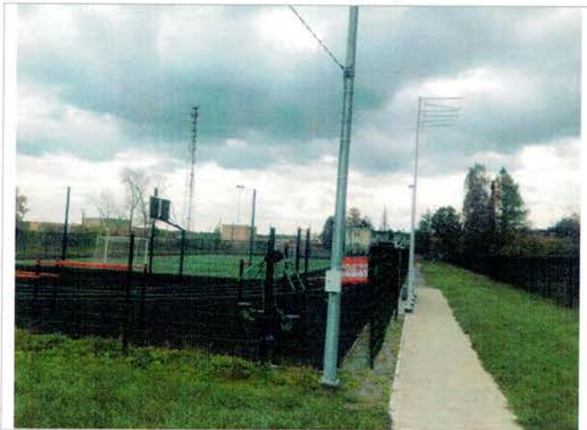
Фото №5 – Прилегающая территория. Спортивная площадка.