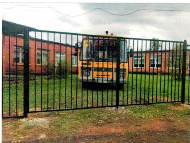
Фото №36 – Школьный автобус