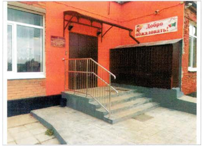
Фото №8 – Входная площадка главного входа