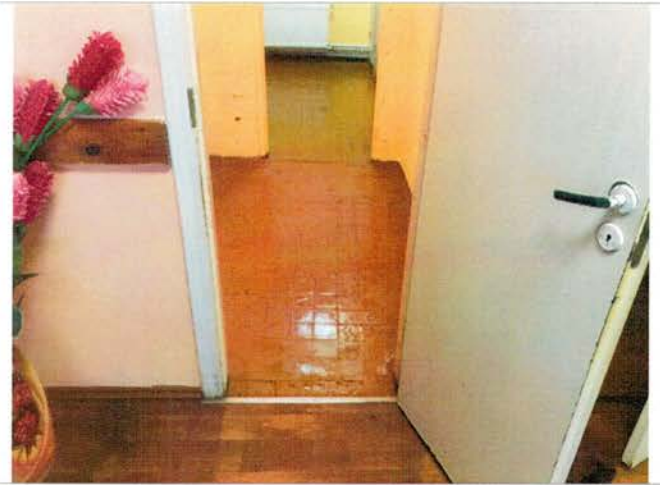
Фото №26 – Санитарно-гигиенические помещения