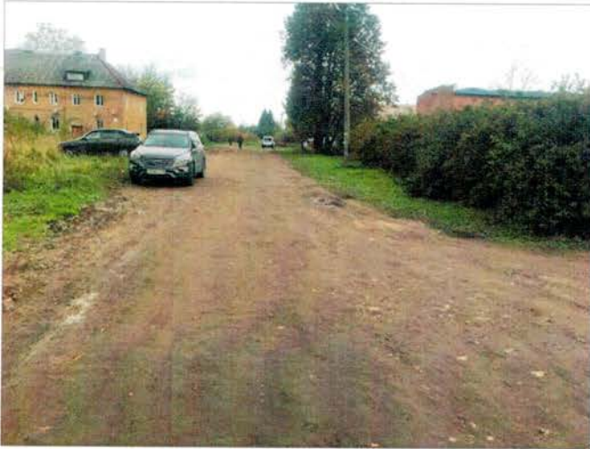
Фото №1 – Подходы к объекту

187040, Ленинградская область, Госненский район, г. п. Рябово, ул. Новая, д.9