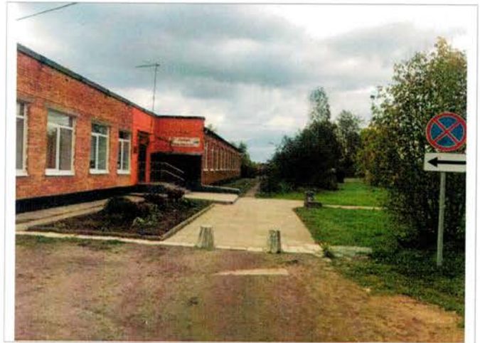
Фото №4 – Прилегающая территория