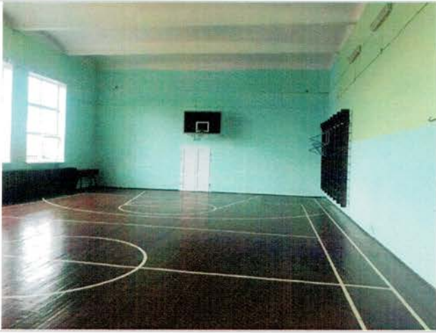
Фото №25 – Зона целевого назначения (посещения). Спортзал.