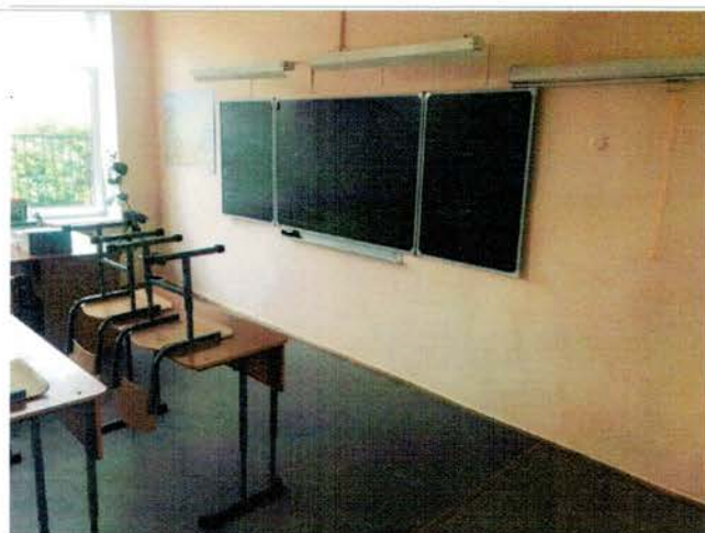
Фото №22 – Зона целевого назначения (посещения)