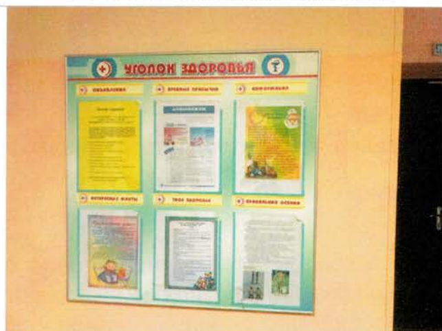
Фото №34 – Система информации