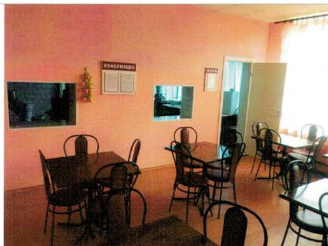
Фото №24 – Зона целевого назначения (посещения). Столовая.