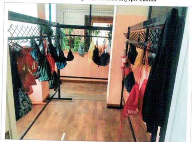
Фото №15 – Гардероб.