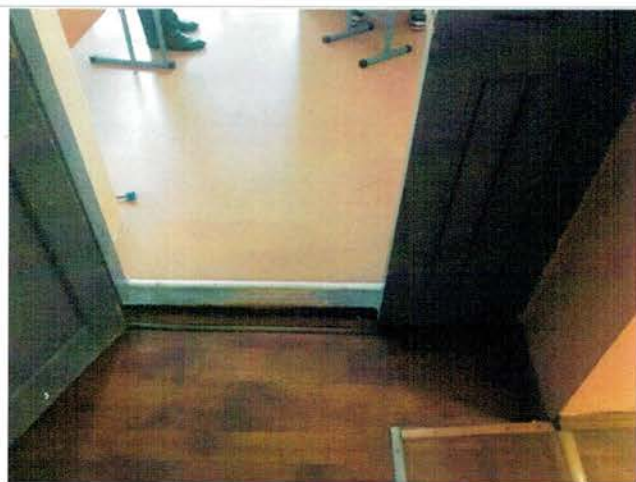
Фото №19 –Пути движения внутри здания (двери)