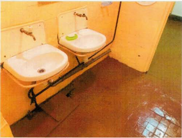
Фото №27 – Санитарно-гигиенические помещения