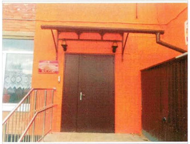
Фото №10 – Входная площадка главного входа