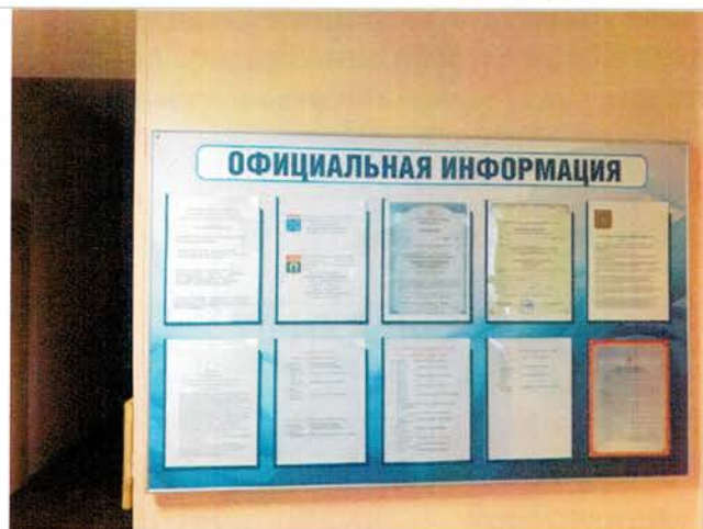
Фото №33 – Система информации