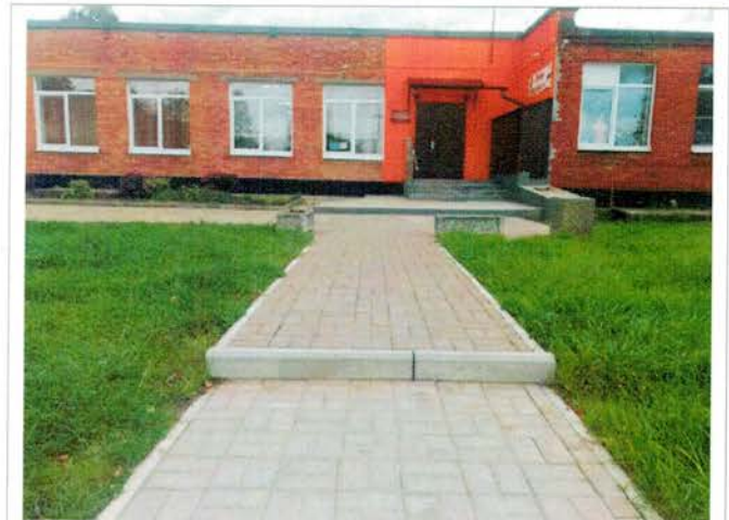
Фото №6 – Прилегающая территория