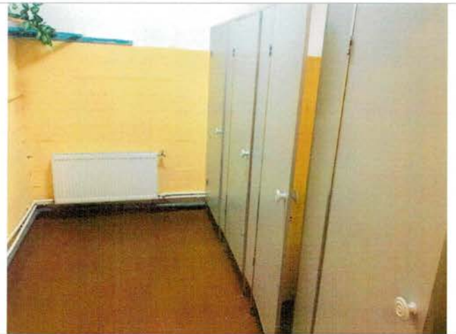
Фото №28 – Санитарно-гигиенические помещения