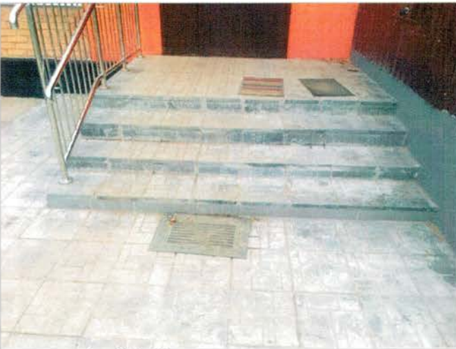
Фото №9 – Наружная лестница главного входа