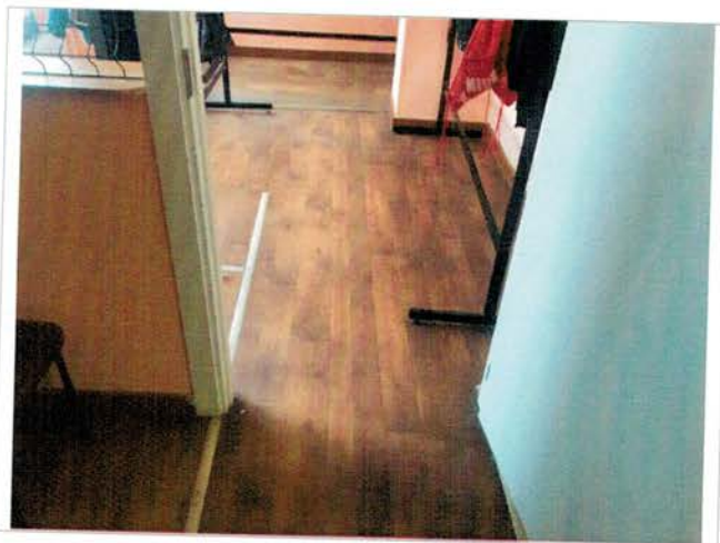
Фото №14 – Гардероб.