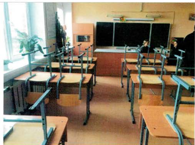
Фото №20 - Зона целевого назначения (посещения)